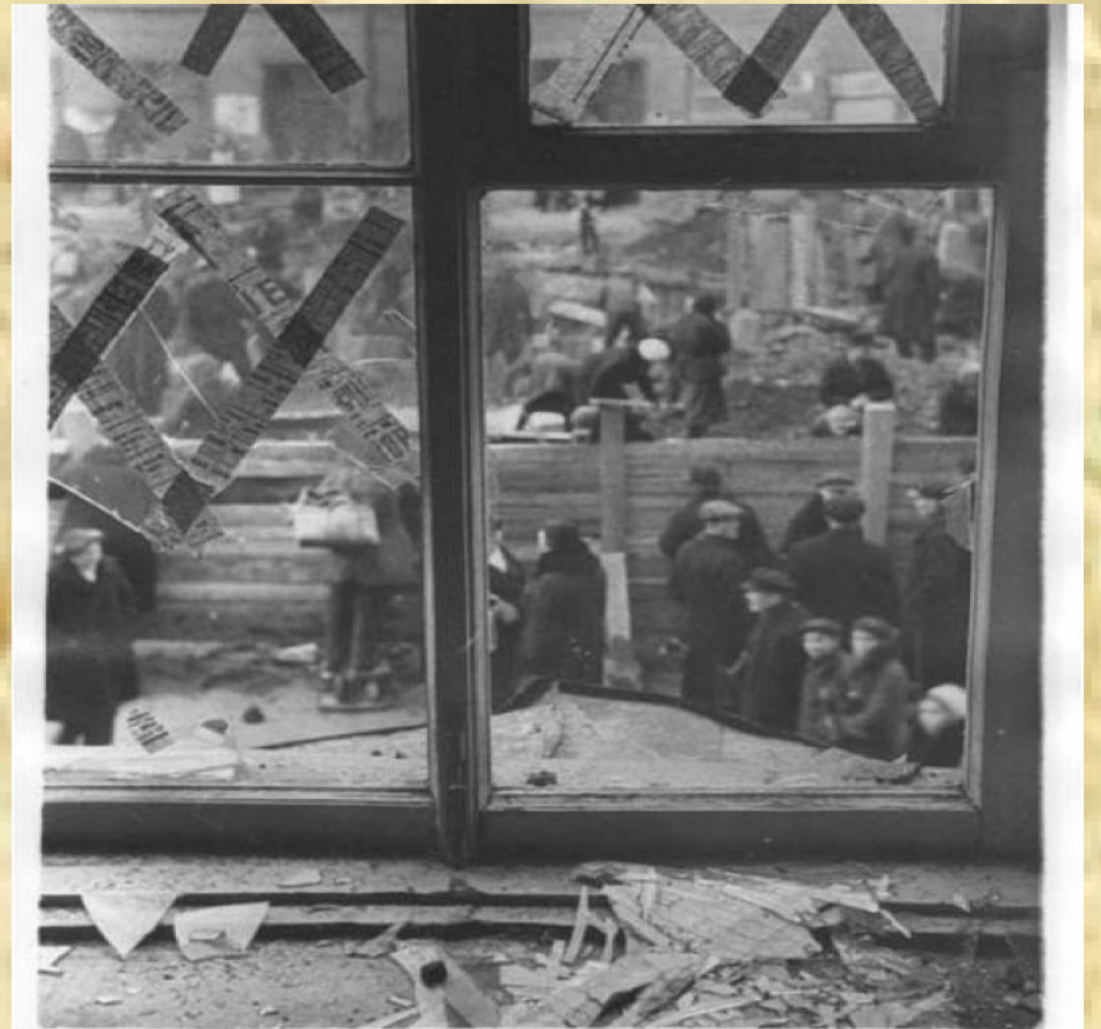
Рис. 1. Подготовленные к авианалетам окна

Начальники всех сформированных соединений были направлены на трехдневный семинар без отрыва от производства.