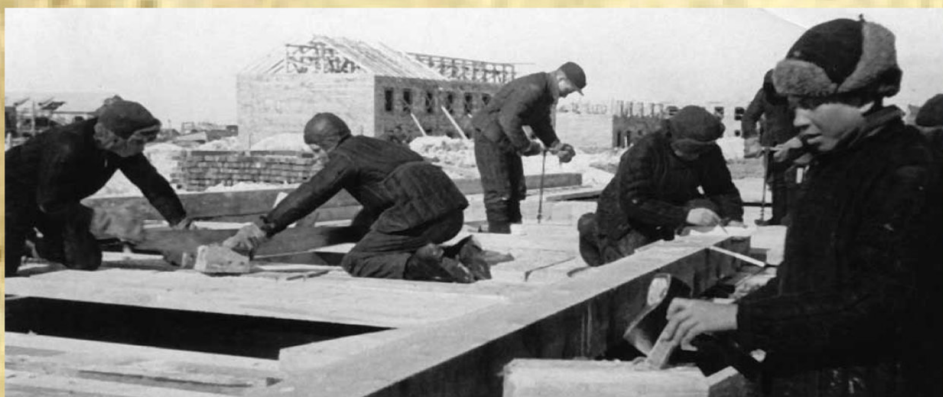
Рис. 3. Работы по кладке кирпича

03 августа 1942 года принято решение о назначении государственного пособия двенадцати многодетным матерям, которые родили седьмого и более детей в 1941-1942 гг.