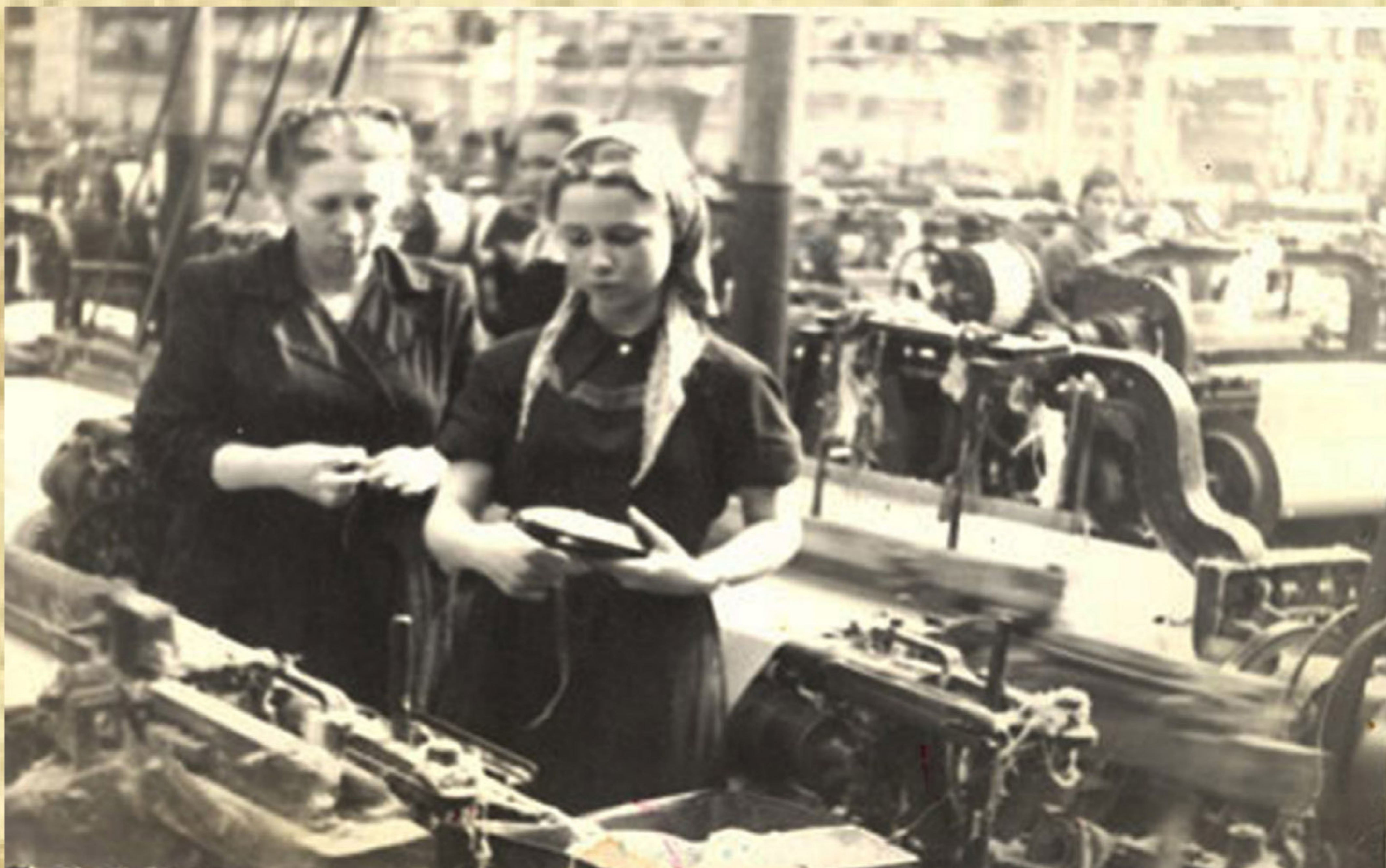
Рис. 8. На обувной фабрике

17 августа 1944 года в соответствии с телеграфным указанием Совнаркома СССР № 120-1 от 03 августа 1944 года принято решение отработать один выходной день – 27 августа – с целью производства обуви и одежды для детей в возрасте от 7 до 14 лет на предприятиях легкой и кооперативной промышленности.