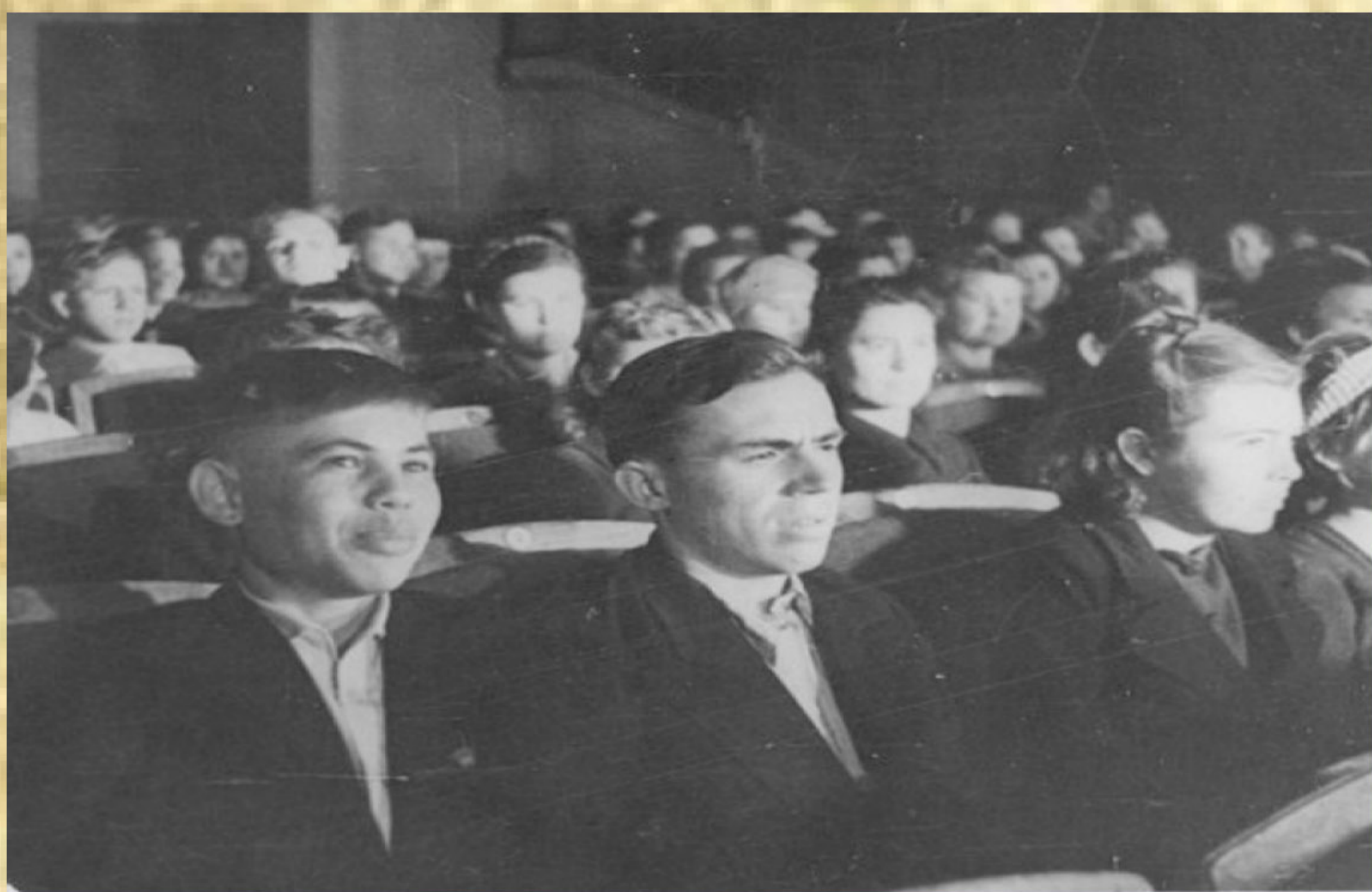
Рис. 6. На торжественном собрании

26 августа 1943 года в связи с 50-летним юбилеем со дня основания города Новосибирска исполком горсовета принял решение о создании комиссии, занятой подготовкой празднования в следующем составе (См. Рис. 7).