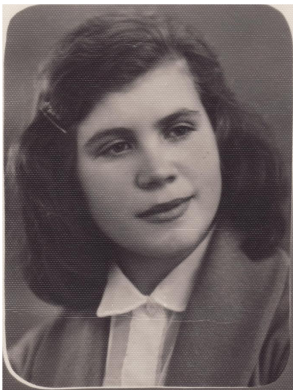
4 курс ТГУ ИФФ. 1960 год, г. Томск