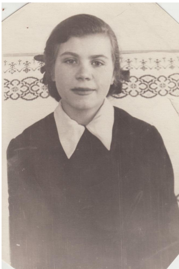
9 класс, 1954 г.