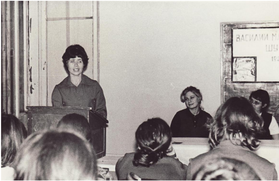
Вечер, посвященный памяти Василия Макаровича Шукшина, НГПИ