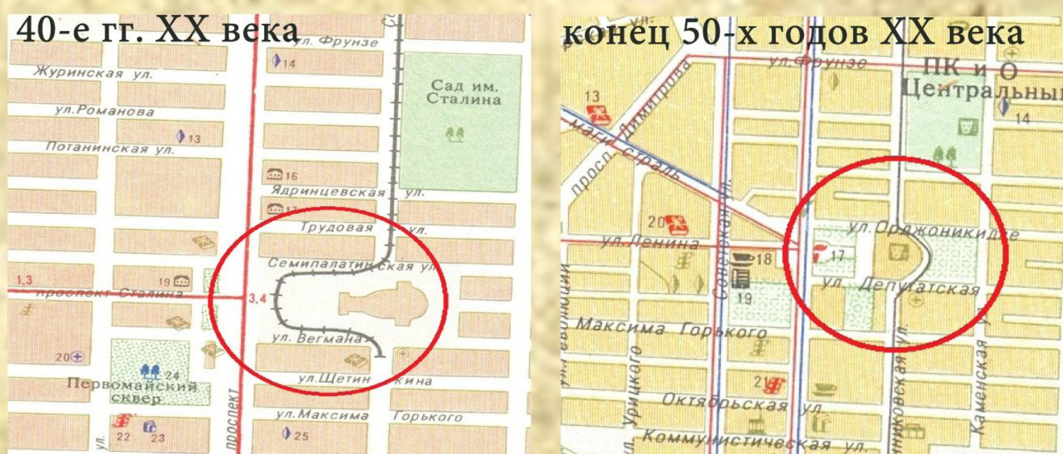
Рис. 12. Схема движения трамвая по маршруту пл. им. Сталина - Оперный театр

13 апреля 1945 г. принят проект пути движения трамвая по новой трассе – с пл. имени Сталина (в наст. вр. – пл. имени Ленина) за Оперный театр, на время ремонтных работ движение трамвая было организовано по однопутному графику.