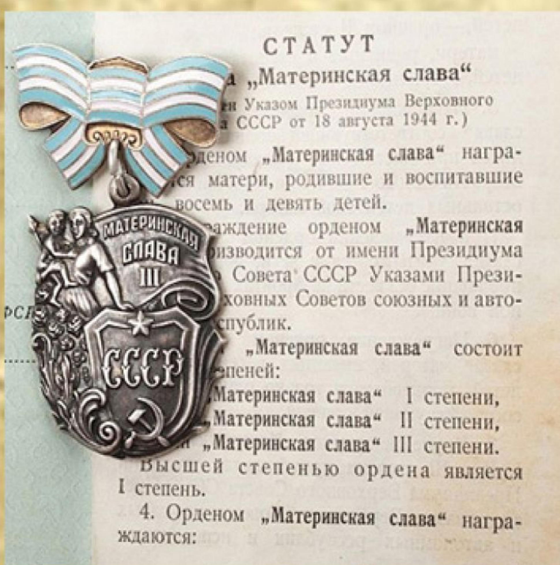
Рис. 11. Орден «Материнская слава»

Звание «Мать-героиня» - высшая степень отличия Советского Союза, установленная для женщин за заслуги в рождении и воспитании детей. Присваивается матерям, родившим и воспитавшим десять и более детей. Введение звания «Мать-героиня» и одноименного ордена особо подчеркивали то, как остро в то время наша страна нуждалась в молодежи, воспитании нового поколения.