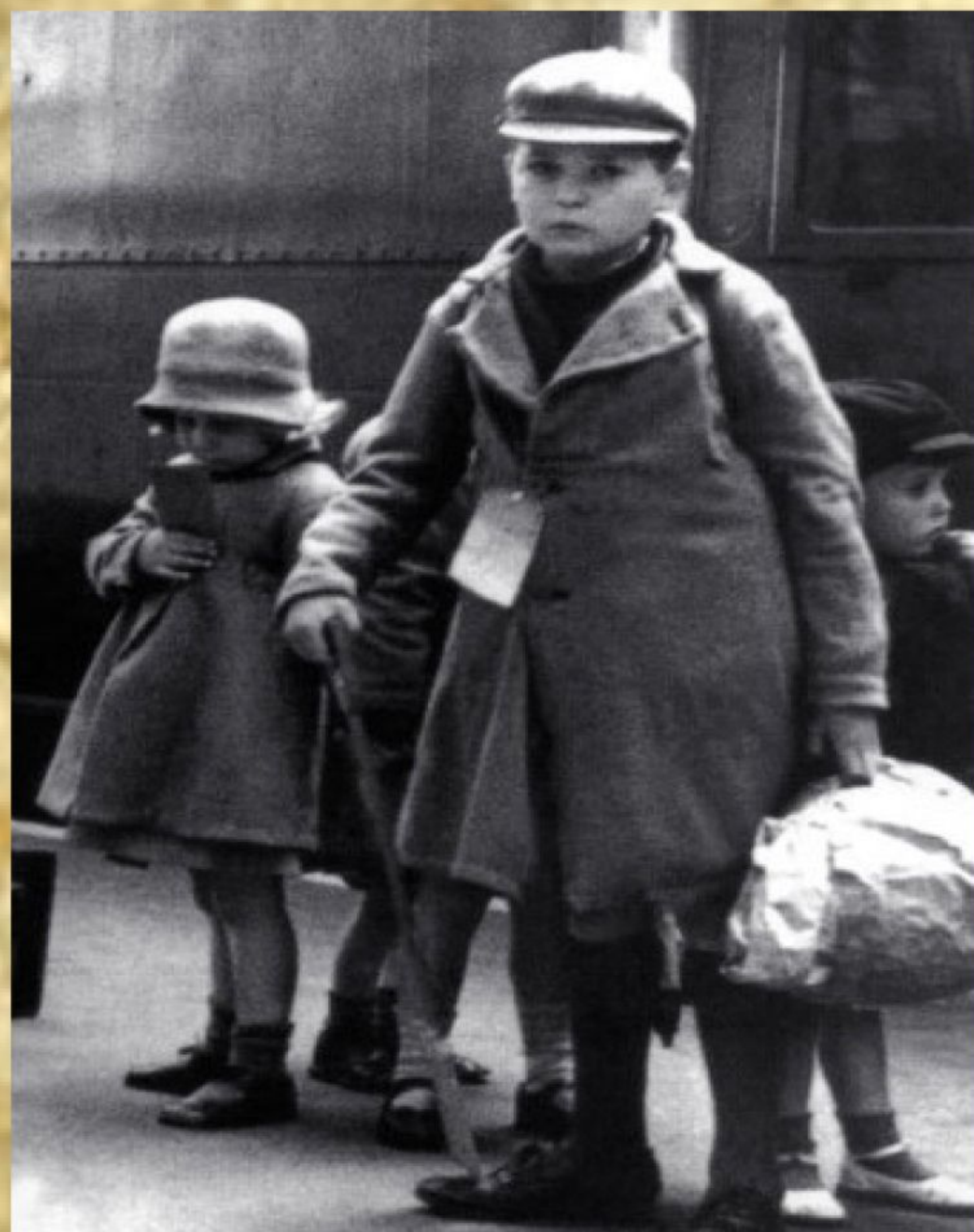
Рис. 1. Дети в эвакуации

8 апреля 1942 г. Новосибирский горисполком объявил зав. торговделом Валеева произвести выдачу продуктов эвакуированным детям, размещенным на базе тубсанатория.