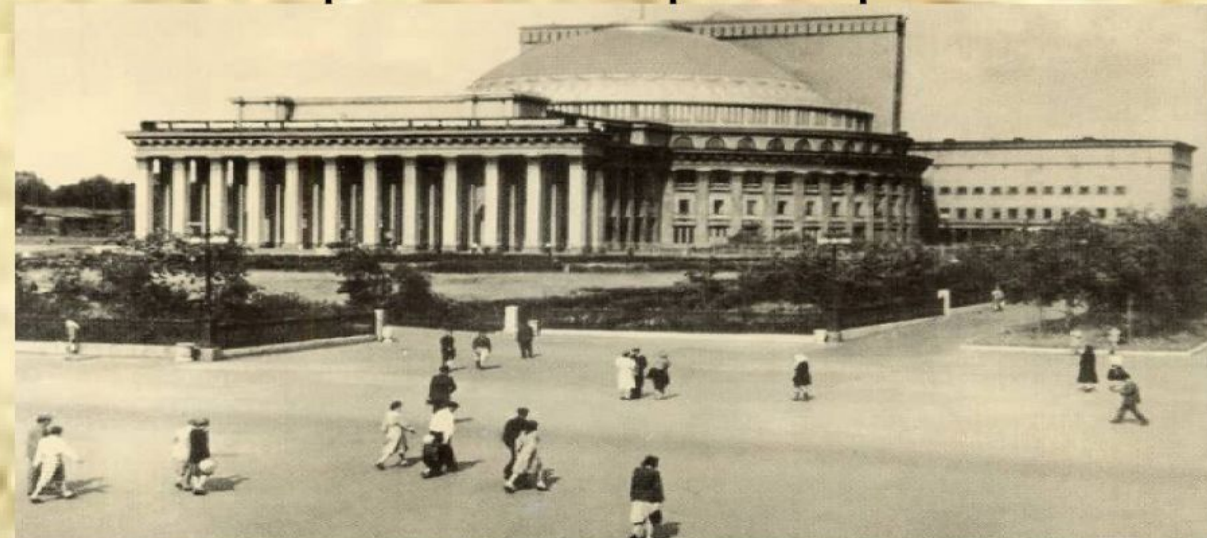
Рис. 13. Новосибирский театр оперы и балета. 1972 год