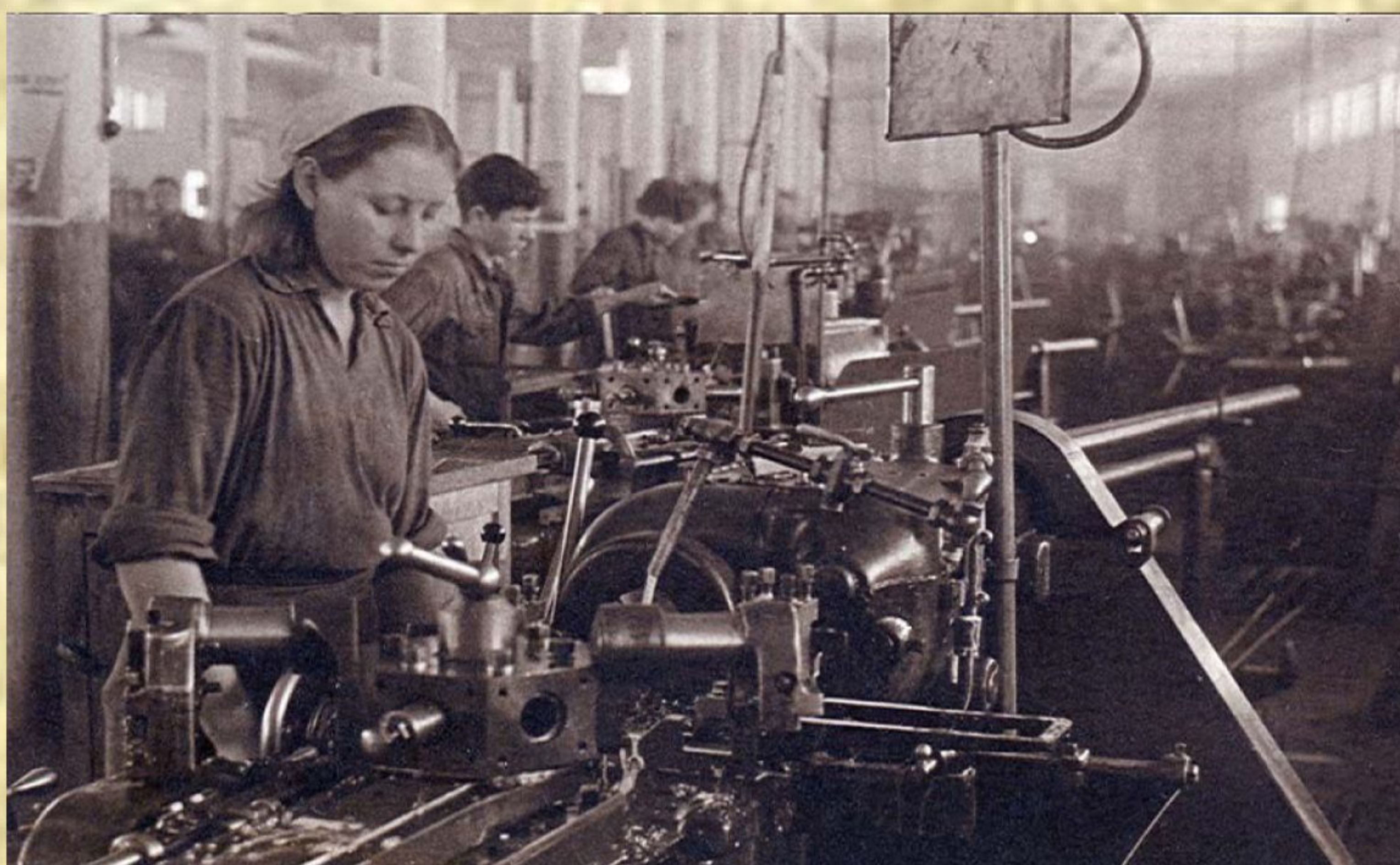
Рис. 3. Работница у заводского станка

10 апреля 1942 г. Новосибирскому заводу № 617 (наст. вр. – Новосибирский электровакуумный завод), созданному на базе оборудования эвакуированного ленинградского завода № 211 «Светлана» и металлургического цеха Московского электролампового завода, выделены свободные дома из числа дач горисполкома и барак Осоавиахима для размещения рабочих.