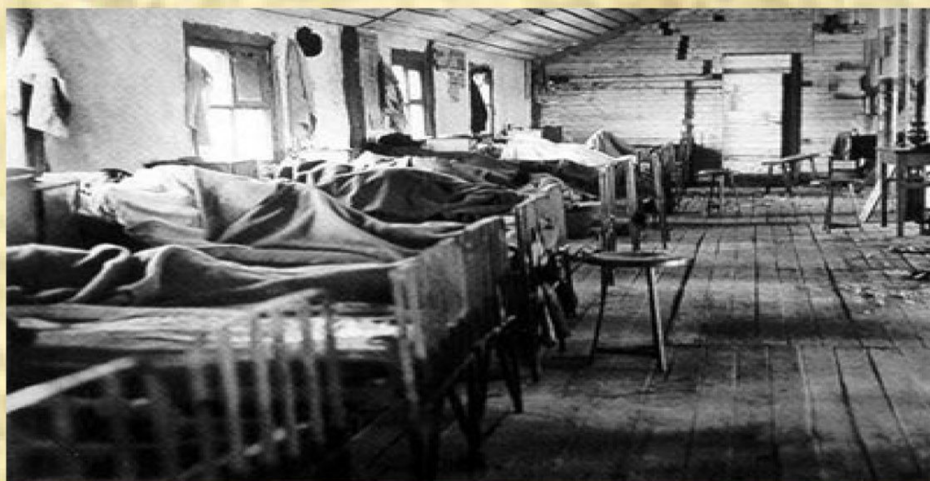
Рис. 5. Помещение Обсервационного пункта

13 июля 1942 года решением Новосибирского горисполкома начата разгрузка помещений Обсервационного пункта, который был создан с целью проведения противоэпидемических мероприятий пребывающих из эвакуированных районов в Новосибирске.