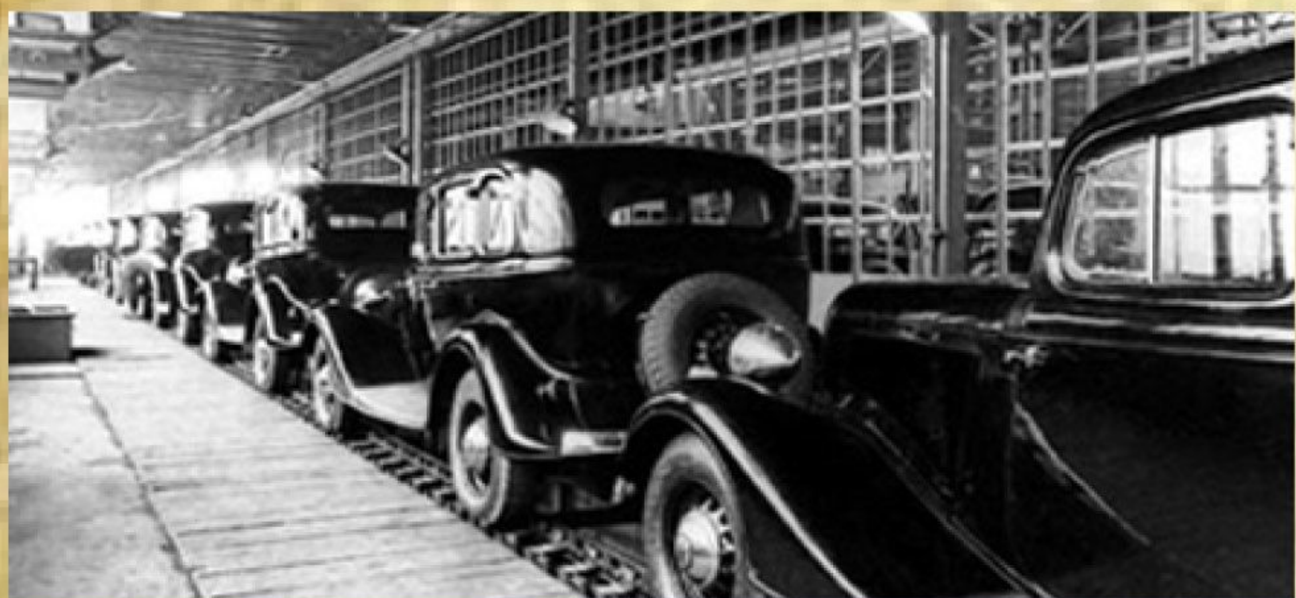
Рис. 4. Автомобиль марки «М-1»

13 июля 1942 года решением Новосибирского горисполкома начата разгрузка помещений Обсервационного пункта, который был создан с целью проведения противоэпидемических мероприятий пребывающих из эвакуированных районов в Новосибирске.