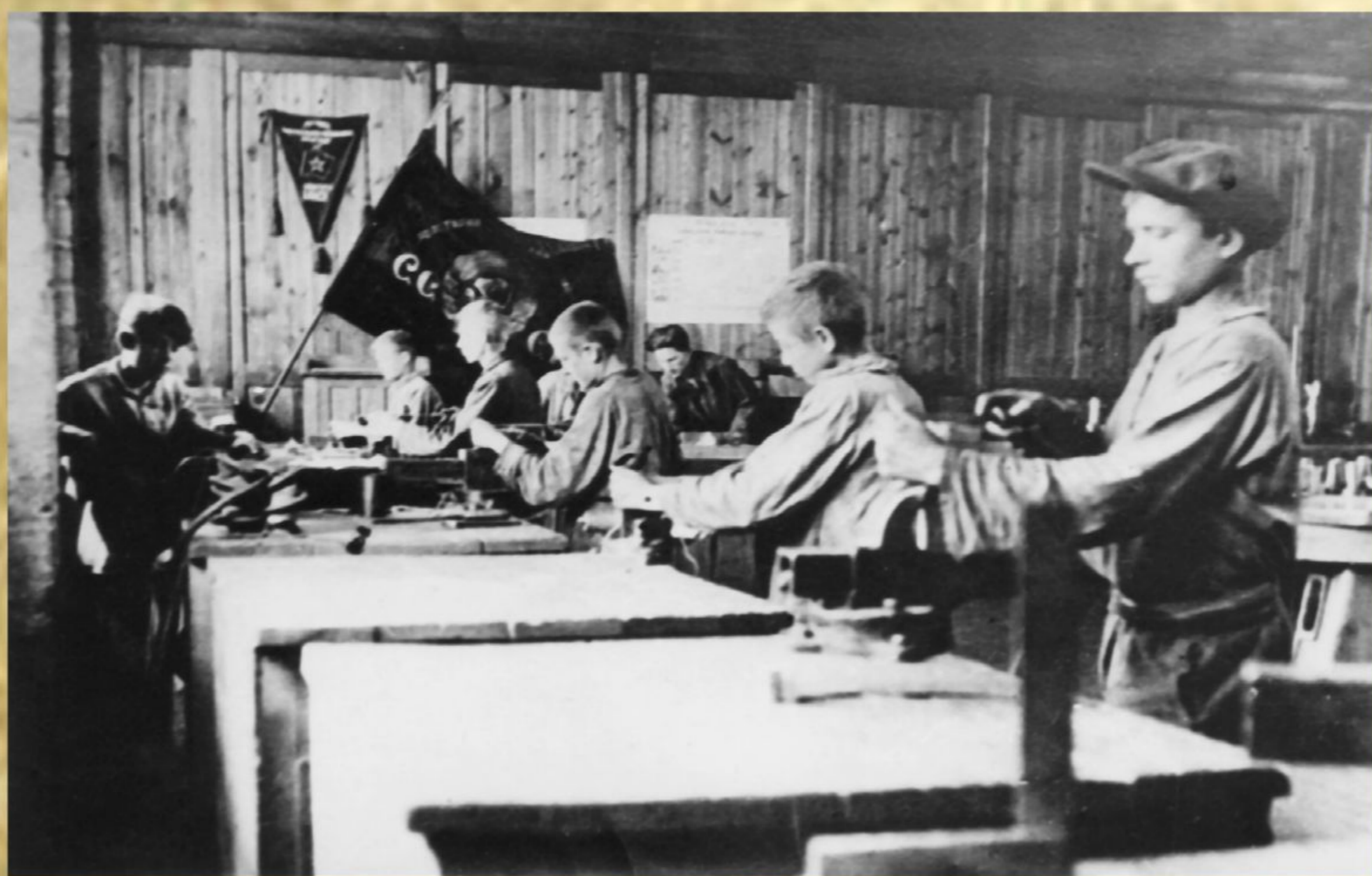
Рис. 6. Участок ремесленного училища завода

21 августа 1942 года приказом наркома станкостроения А.И. Ефремова завод тяжелых и расточных станков переименован в завод тяжелых станков и крупных гидропрессов «Тяж-станкогидропресс».