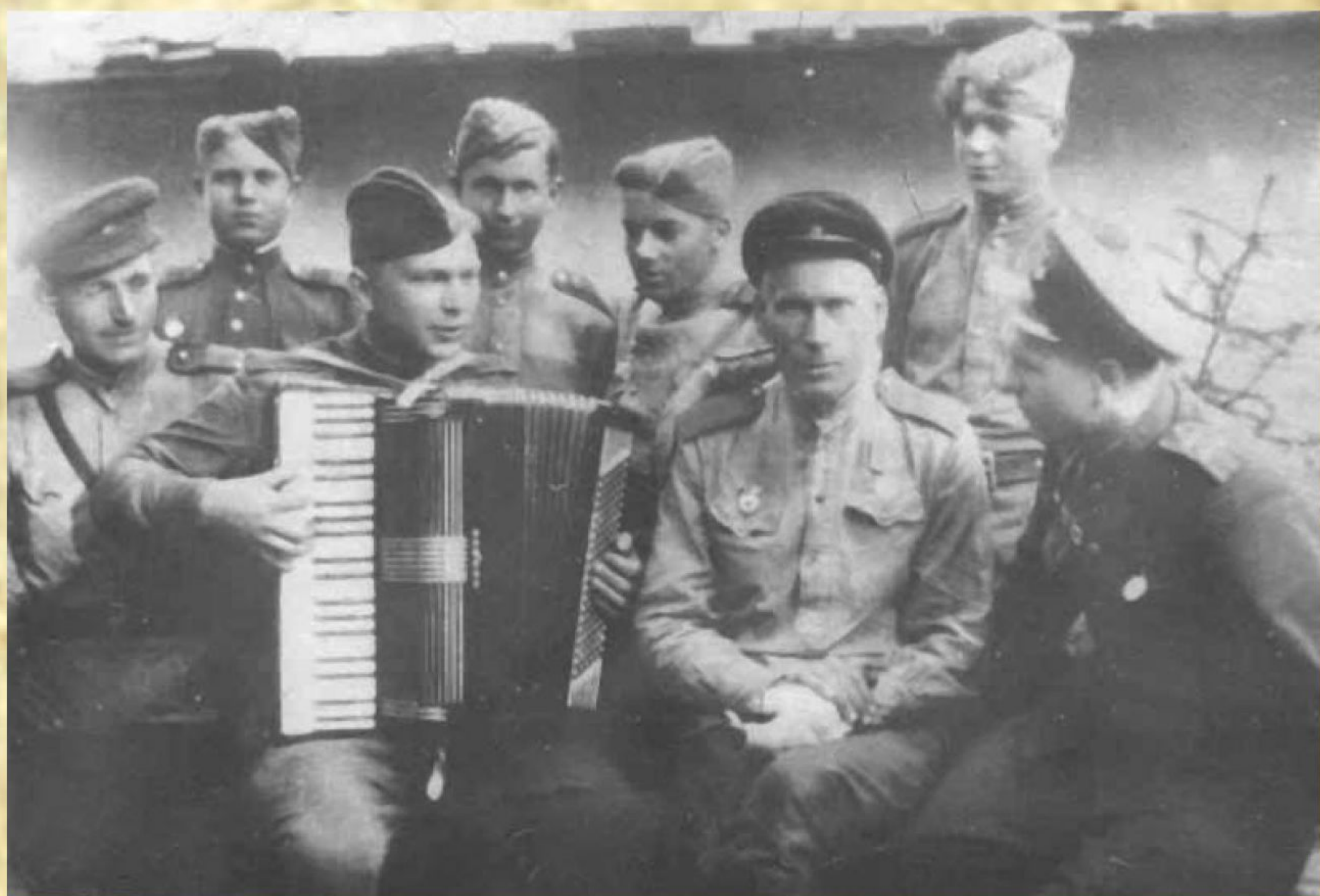
Рис. 9. На конкурсе военной песни

Другими известными творениями Пухначёва и Новикова стали «Песня сибирских полков» и «Нас не запугать», в которых нашёл своё отражение патриотический порыв советского народа в борьбе с фашистскими захватчиками.