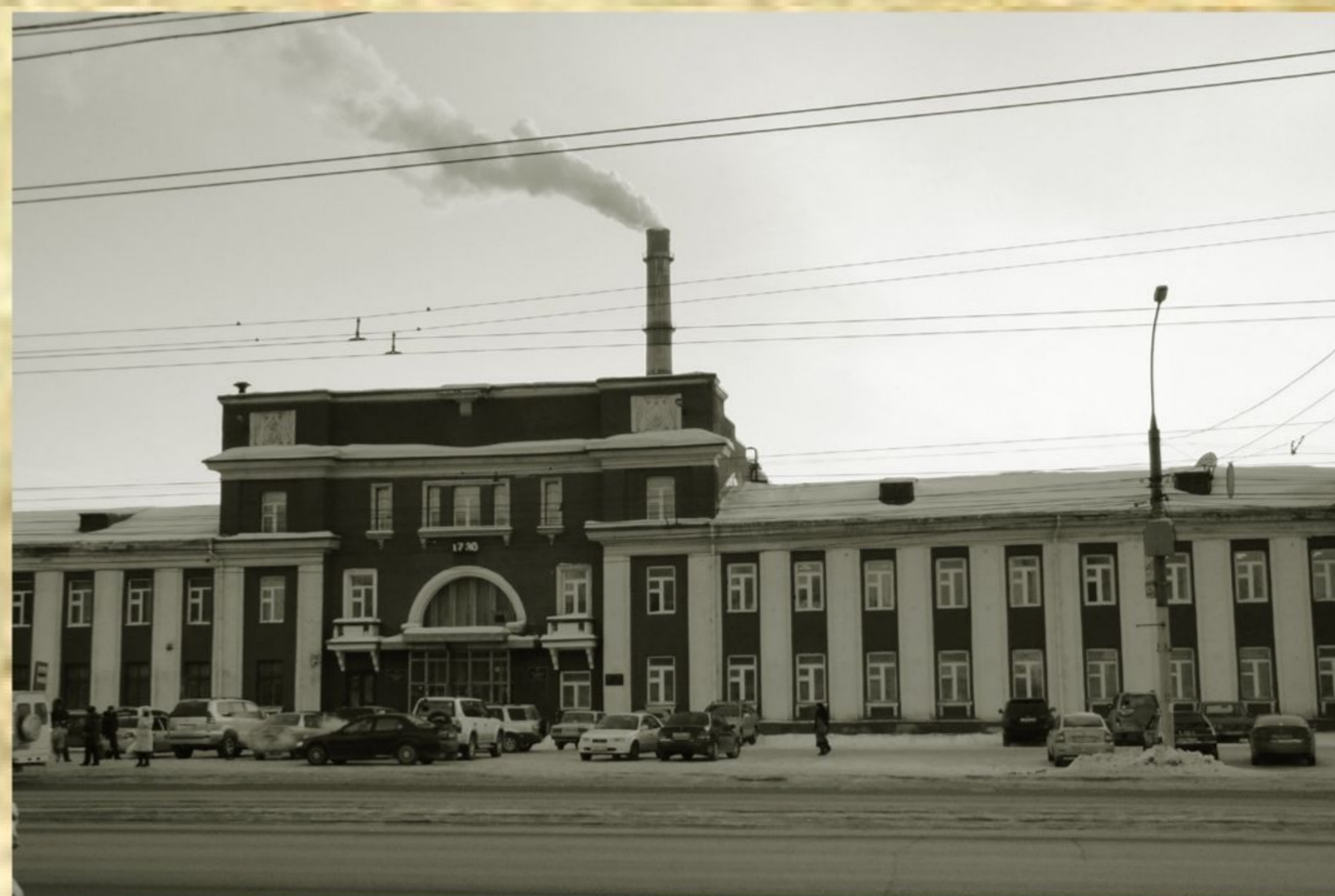
Рис. 7. Новосибирский оловозавод

В 1944 году при заводе открыт первый в Новосибирске вечерний техникум на 100 человек, который готовил специалистов по холодной обработке металлов, техников-технологов и техников-механиков. Сочетая учебу с трудом, вчерашние школьники овладевали навыками будущей профессии.