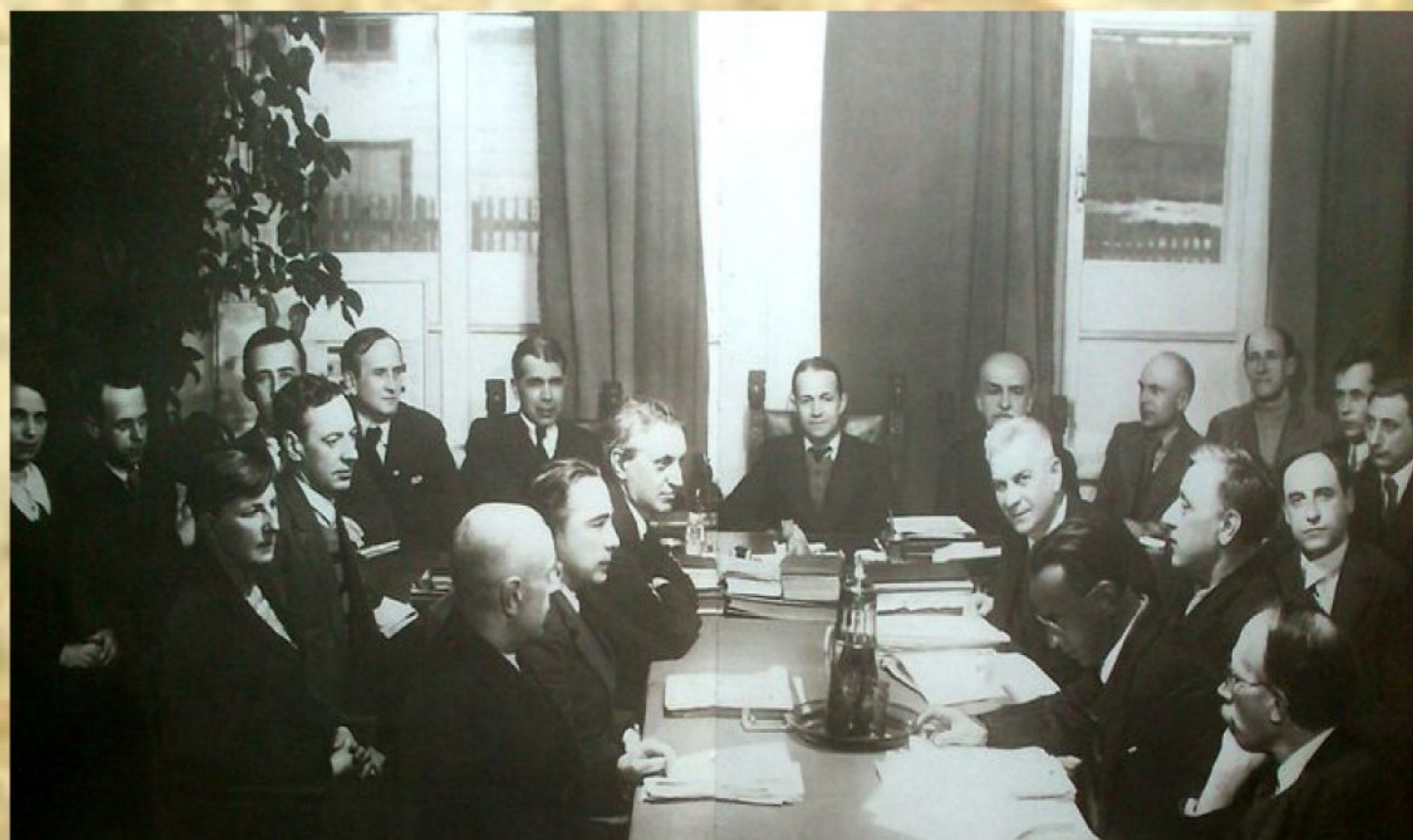
Рис. 3. Новосибирский комитет ученых

В военной обстановке научно-техническая помощь производству рассматривалась как главное направление научной деятельности. Связь науки с ведущими отраслями производства осуществляли 13 специализированных секций.