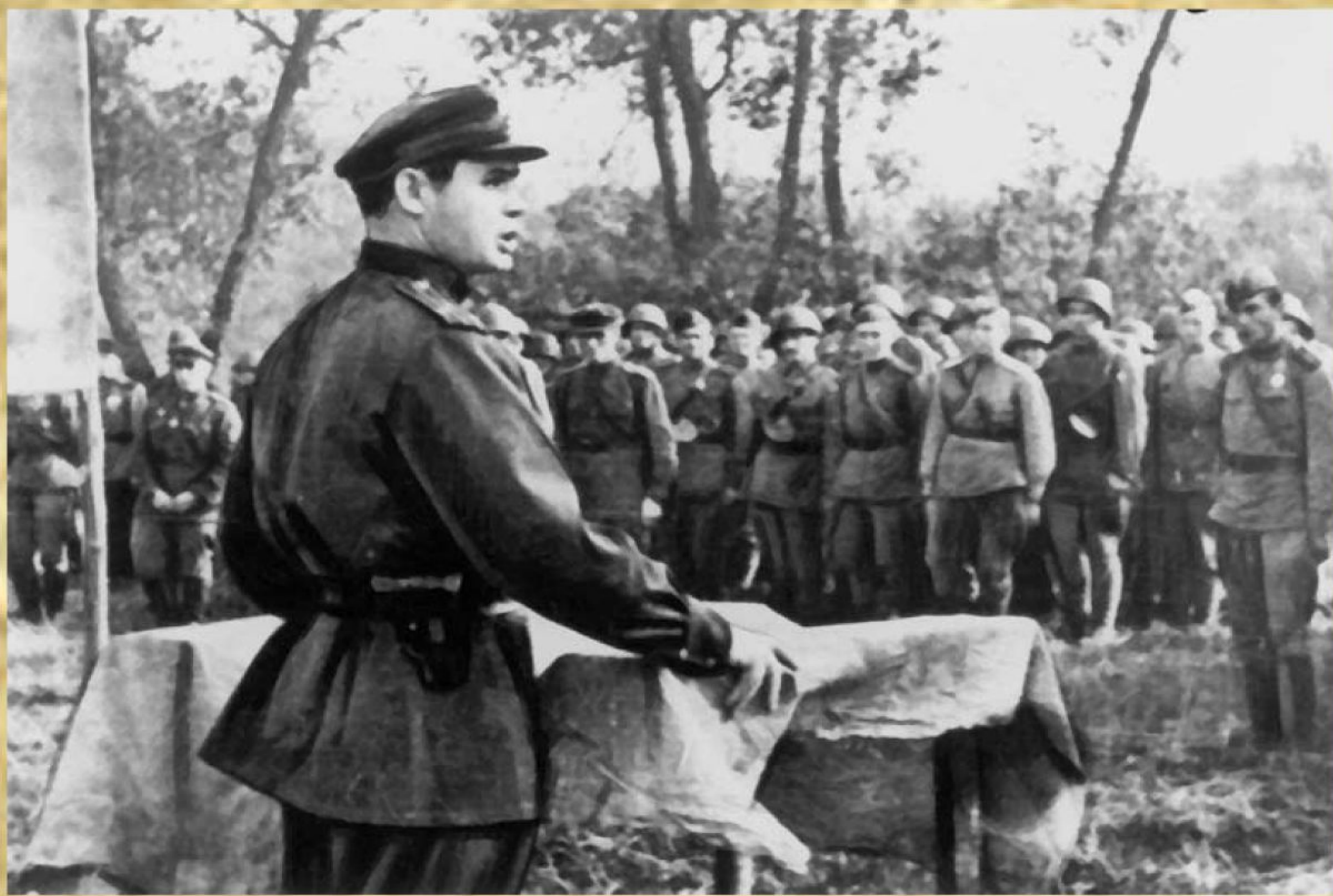
Рис. 8. Бойцы перед отправкой на фронт

Во второй половине февраля 1942 года закончилось формирование 235-й стрелковой дивизии. Штаб формирования находился в Новосибирске. В состав дивизии вошли 732-, 801-, 806-й стрелковые и 682-й артиллерийский полки. Первым командиром дивизии был назначен полковник С. Г. Гайфутдинов. В феврале 1942 года дивизия прибыла в Грязовецкий район Вологодской области, где проходила обучение и получала штатное вооружение и снаряжение.