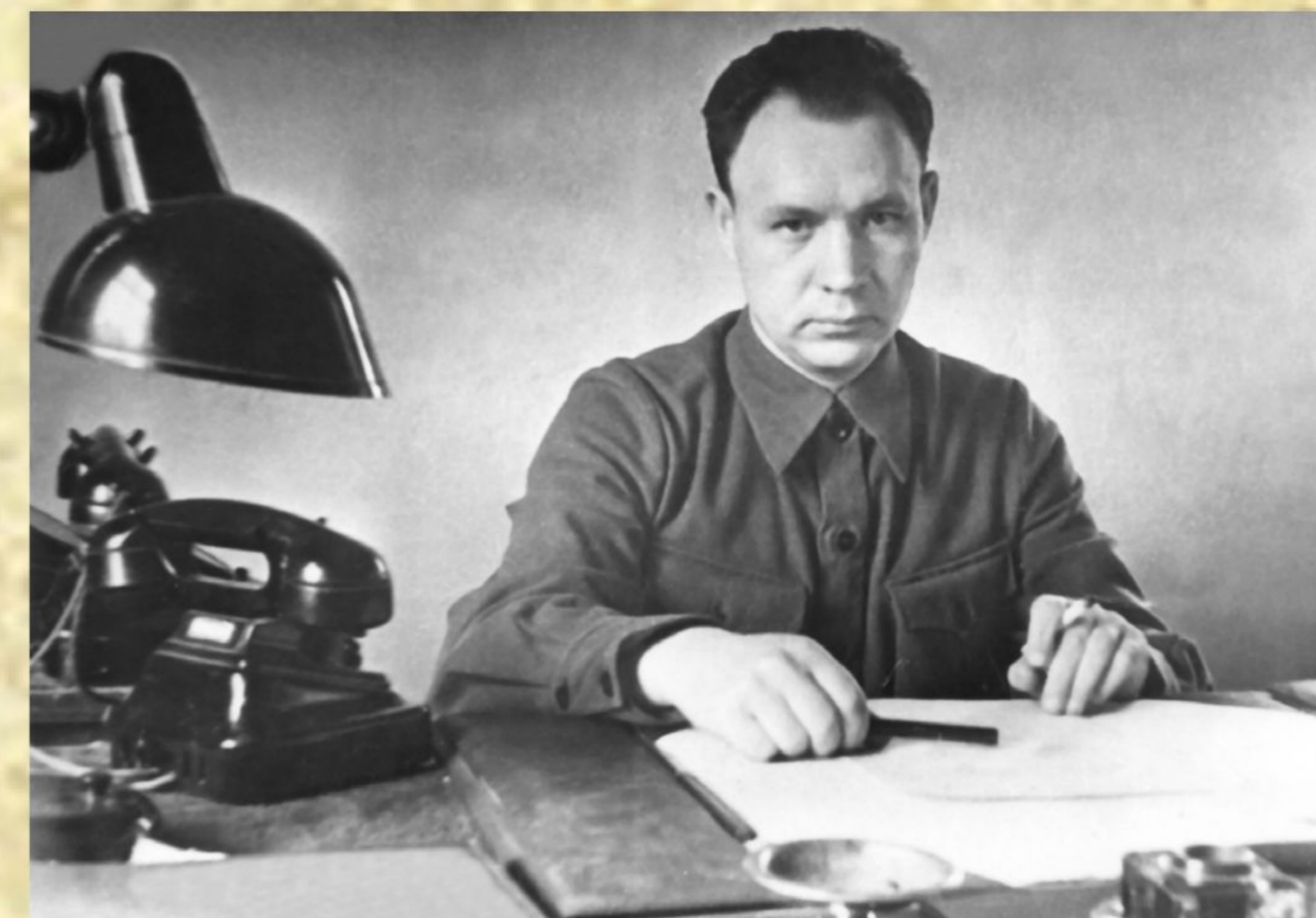
Рис. 5. Д.И. Поляков - первый директор завода

23 февраля 1942 года первую продукцию выпустил Новосибирский оловозавод, впервые в истории Сибири еще недостроенный завод начал выплавлять ценнейший металл. Первая выплавка металла планировалась на конец 1942 года, но фронт требовал металл немедленно и в больших количествах, в связи с чем в первые месяцы 1942 года коллектив доложил правительству о начале выпуска готовой продукции.