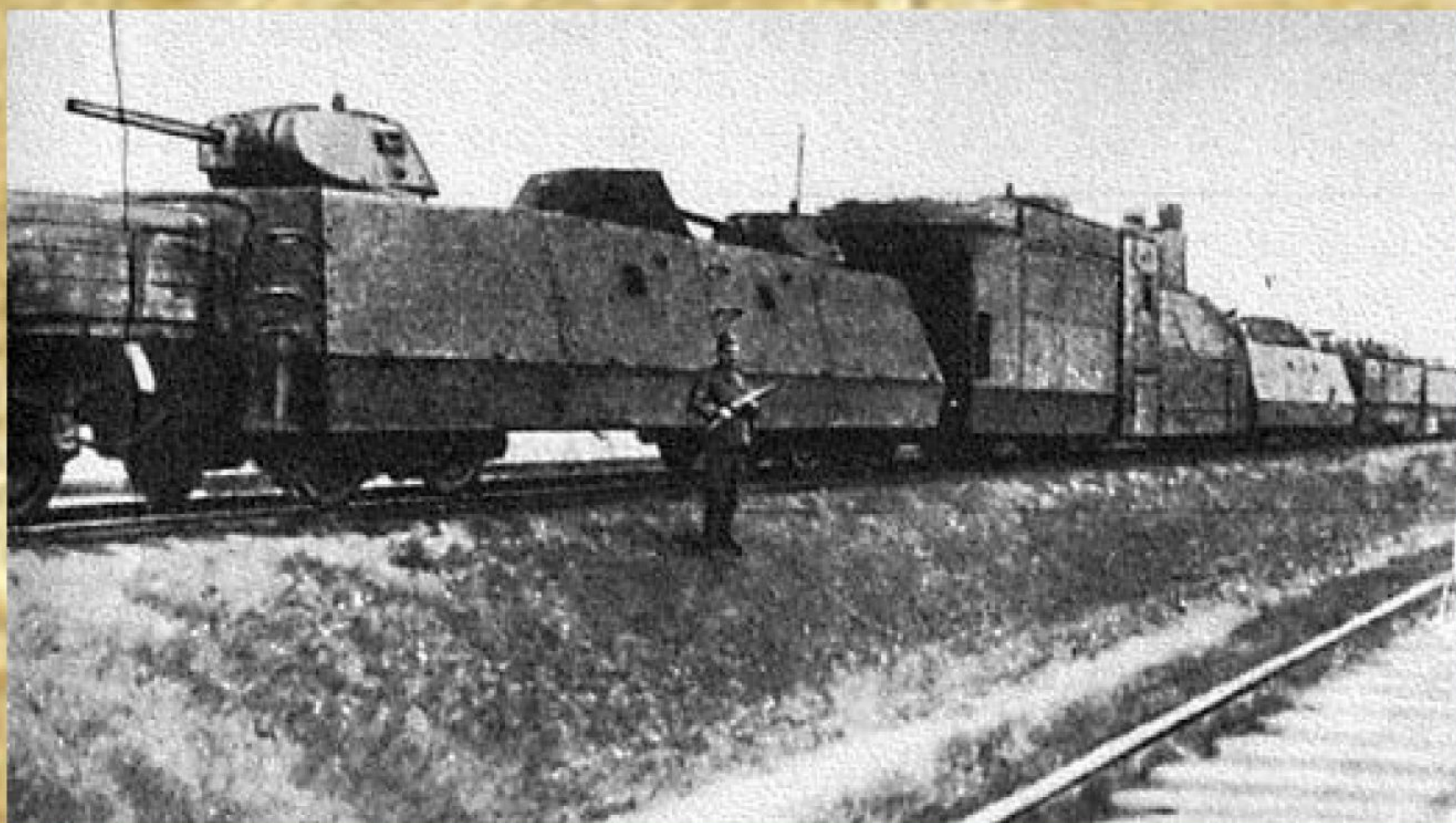
Рис. 4. Бронепоезд «Советская Сибирь»