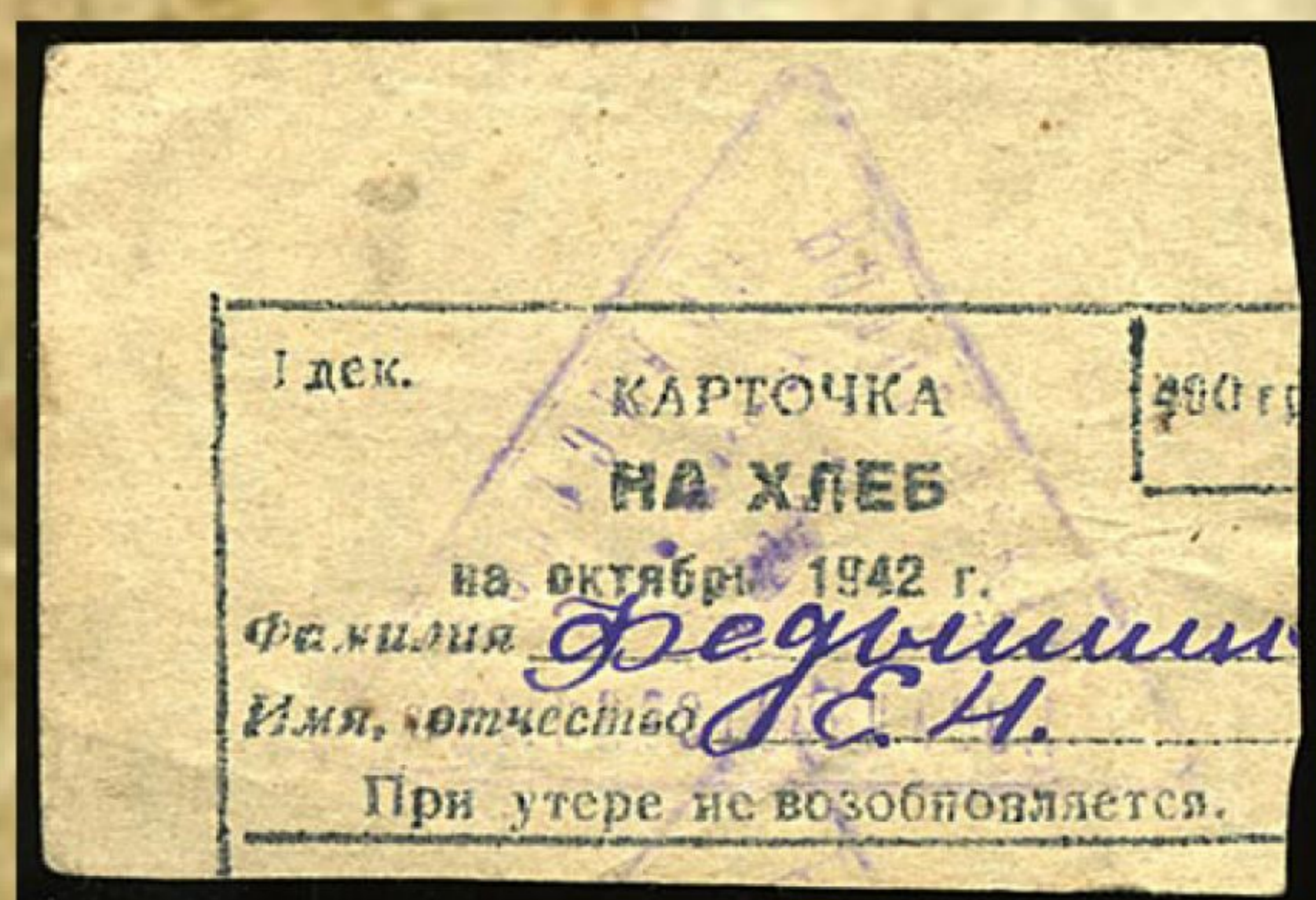
Рис. 2. Карточка на хлеб

10 февраля 1942 года Новосибирский комитет ученых организовал общегородское собрание научной общественности, принявшее решение о всемерном содействии ученых укреплению оборонной способности страны.